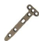
Placa Rádio Distal Lateral em T 2.7mm