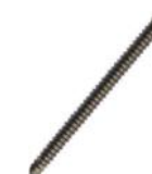
Parafuso de Bloqueio 2.7mm automacheante