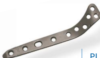
PLACA DE TÍBIA PROXIMAL LATERAL 4.5/5.0MM