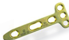
PLACA RÁDIO DISTAL DORSAL EM T 2.4/2.7MM

Orifícios distais permitem a utilização de parafusos de ângulo fixo e variável.