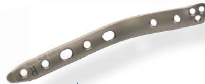
PLACA ÚMERO DISTAL MEDIAL 2.7/3.5MM