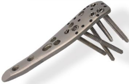
PLACA ÚMERO PROXIMAL TARGETING 3.5MM