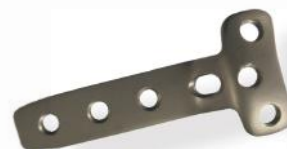
PLACA EM T DUPLA CURVA 4.5/5.0MM