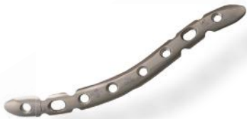
PLACA CLAVÍCULA ANATÔMICA 3.5MM