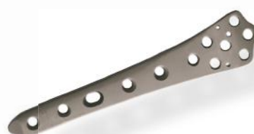
PLACA FÊMUR DISTAL 4.5/5.0MM