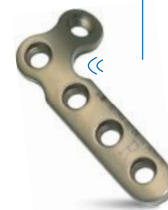
PLACA BLOQUEADA EM L 2.7MM