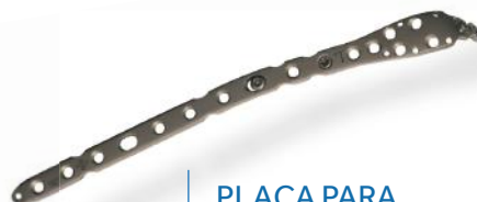
PLACA PARA OLÉCRANO 3.5MM