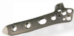
PLACA ÚMERO DISTAL DORSAL 3.5MM