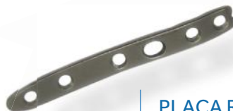
PLACA RÁDIO DISTAL LATERAL 2.7MM