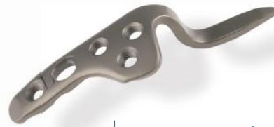
PLACA CLAVÍCULA COM GANCHO 3.5MM