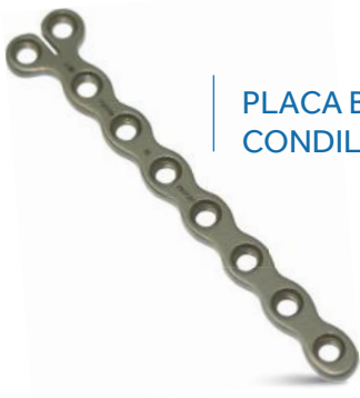
PLACA BLOQUEADA CONDILAR 2.4MM