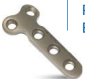
PLACA BLOQUEADA EM T 2.7MM

* Consulte nosso site para demais modelos de placas