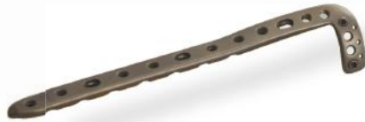
PLACA EM L PARA TÍBIA DISTAL ANTEROLATERAL 3.5MM