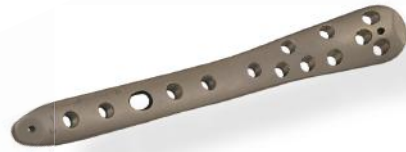
PLACA TÍBIA DISTAL II 3.5MM