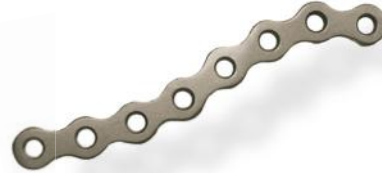
PLACA CLAVÍCULA ANATÔMICA EM S 3.5MM