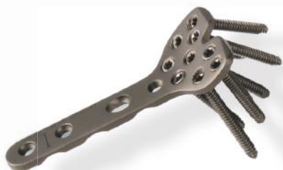
PLACA PARA RÁDIO DISTAL 2.7MM