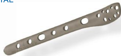
PLACA ANATÔMICA FÍBULA DISTAL 2.7/3.5MM