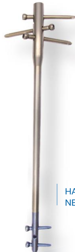
HASTE NEOGEN TÍBIA