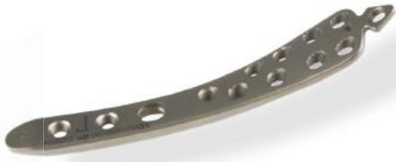
PLACA TÍBIA DISTAL 3.5MM