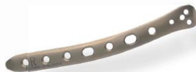
PLACA ÚMERO DISTAL DORSAL 2.7/3.5MM