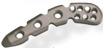
PLACA PARA CLAVÍCULA ANTEROLATERAL 2.7/3.5MM