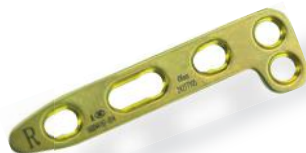
PLACA RÁDIO DISTAL DORSAL 2.4/2.7MM