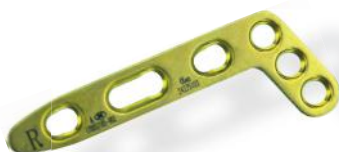
PLACA RÁDIO DISTAL DORSAL OBLÍQUA 2.4/2.7MM