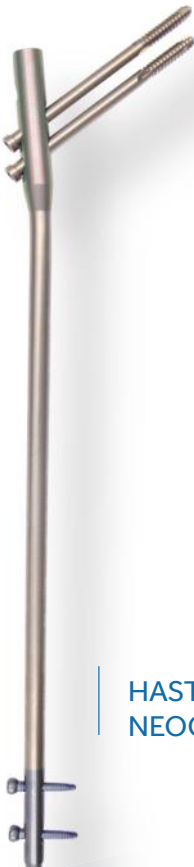
HASTE NEOGEN FÊMUR