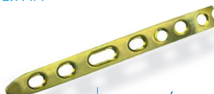
PLACA RÁDIO DISTAL LATERAL 2.4/2.7MM