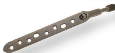
SISTEMA DHS/DCS BLOQUEADO 4.5/5.0MM