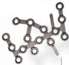
PLACA CALCÂNEO 3.5MM