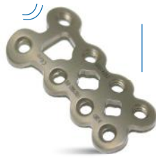
PLACA BLOQUEADA SUPORTE 1.5MM