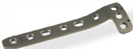
PLACA EM L DUPLA CURVA 4.5/5.0MM