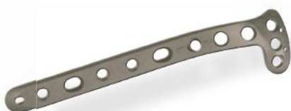
PLACA TÍBIA PROXIMAL EM L 4.5/5.0MM