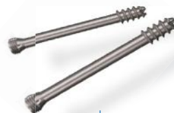
PARAFUSOS CANULADOS HCS 2.4 E 3.0MM