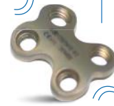
MINI PLACA BLOQUEADA H 2.0MM