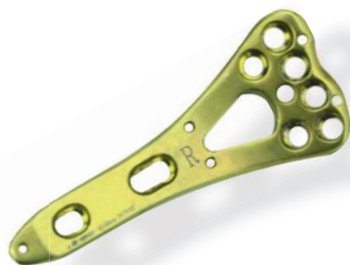
PLACA RÁDIO DISTAL VARILOC 2.4/2.7MM