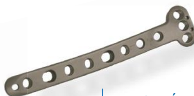
PLACA TÍBIA PROXIMAL MEDIAL 4.5/5.0MM