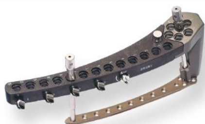
MIS - SISTEMA MINIMAMENTE INVASIVO - FÊMUR E TÍBIA 4.5/5.0MM