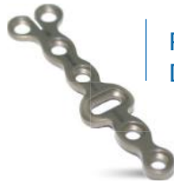
PLACA BLOQUEADA DE ROTAÇÃO 2.0MM