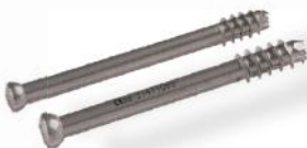
PARAFUSOS CANULADOS 4.0, 4.5 E 7.3MM