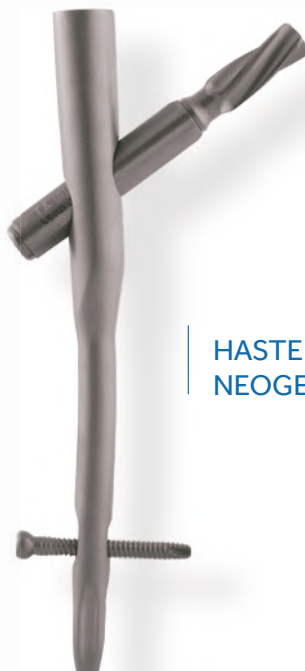
HASTE NEOGEN AR