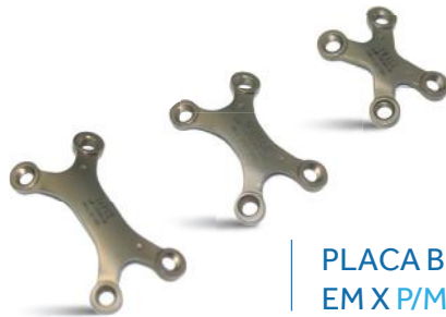
PLACA BLOQUEADA EM X P/M/G