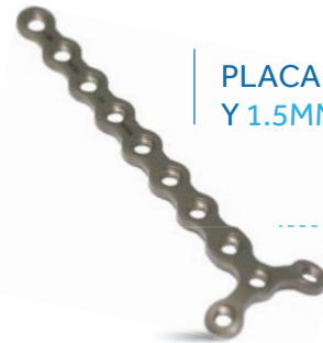
PLACA BLOQUEADA Y 1.5MM