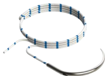
CONFIGURAÇÃO 01 AGULHA

A agulha curva é fabricada com Aço Inoxidável XM-16, atraumática, curva, cilíndrica, círculo, com comprimento de 20 mm para suturas USP #2-0 e 25 mm para suturas USP #2.